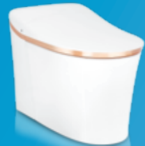
BỒN CẦU THÔNG MINH EIR™ VÀNG ÁNH DƯƠNG K-77795MY-SG-0

NƯỚC PHUN TỪ QUE RỬA ĐẢM BẢO ĐÃ ĐƯỢC LOẠI BỎ HOÀN TOÀN CÁC TAP CHẤT, LƯỢNG CLO DƯ THỪA VÀ KIM LOẠI NẶNG MANG TỚI TRẢI NGHIỆM VỆ SINH HOÀN HẢO.