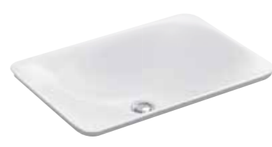
CHẬU RỬA ĐẶT BÀN CARILLON™ (CHỮ NHẬT) K-96117T-0