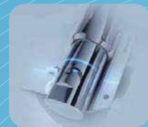
VỆ SINH TOÀN DIỆN VỚI MỘT NÚT NHẤN