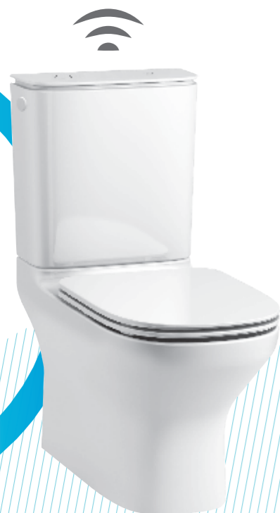
BỒN CẦU 2 KHỐI MODERNLIFE™ K-78799K-TF-0