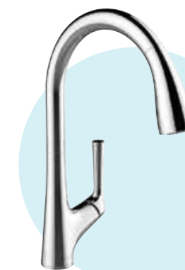
VÒI BẾP CẢM BIẾN VỚI ĐẦU VÒI KIỂU DÂY RÚT MALLECO™ BỀ MẶT MẠ CHROME SÁNG BÓNG (CP) K-77748T-4-CP

VÒI NƯỚC CHO TIA NƯỚC MẠNH DẠNG TIA QUÉT