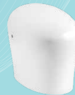
BỒN CẦU THÔNG MINH KARING™ 2.0 K-77780X-0