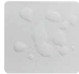
BỀ MẶT SỨ VỚI LỚP PHỦ BỀ MẶT CLEANCOAT®

CÔNG NGHỆ CLEANCOAT® CỦA KOHLER, CHẤT LỎNG TỤ LẠI THÀNH GIỌT DỄ TRÔI, TRÁNH ĐONG NƯỚC LAM Ở BỀ MẶT SẢN PHẨM, MANG LẠI HIỆU QUẢ VỆ SINH LÂU DÀI.