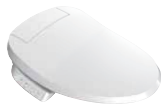
NẮP BỒN CẦU ĐIỆN TỬ C3-430 K-22445X-0