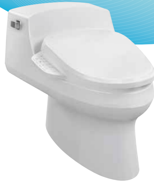
BỒN CẦU TÍCH HỢP SAN RAPHAEL™ & C3-150 K-3722T-HC-0

NẮP BỒN CẦU ĐIỆN TỬ CHO TRẢI NGHIỆM TIỆN NGHI & VỆ SINH ĐẲNG CẤP.