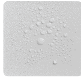
BỀ MẶT SỨ THƯỜNG