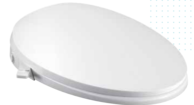
NẮP BỒN CẦU RỬA CƠ C3-030 K-98804K-0