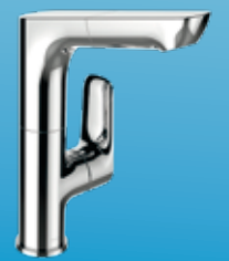
VÒI CHẬU RỬA CÓ DÂY RÚT ALEO ™ S