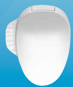
NẮP BỒN CẦU ĐIỆN TỬ FAMILY CARE ™ C3-520