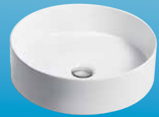
CHẬU RỬA MICA ™