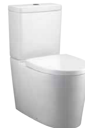
BỒN CẦU HAI KHỐI PARLIAMENT™ GRANDE K-24098K-0