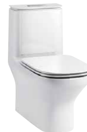
BỒN CẦU MỘT KHỐI MODERNLIFE™ K-77739T-SL-0

MANG ĐẾN MỘT DIỆN MẠO THỜI TRANG VÀ HIỆN ĐẠI