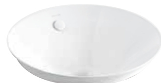
CHẬU RỬA ĐẶT BÀN VEIL ESSENTIAL™ (TRÒN) K-26408T-0