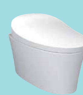
BỒN CẦU THÔNG MINH VEIL™ PHIÊN BẢN GẮN TƯỜNG K-5402K-0