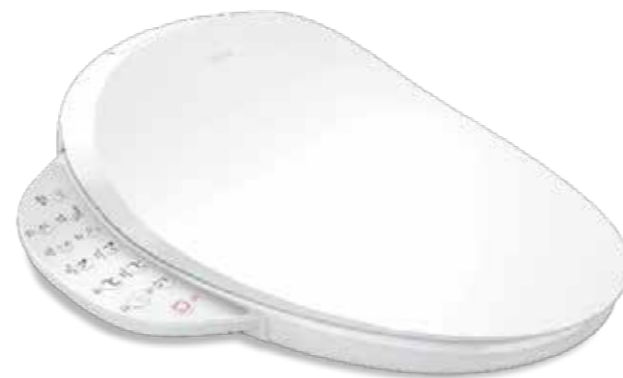
NẮP BỒN CẦU ĐIỆN TỬ C3-520 K-31333KR-0

ĐẢM BẢO NƯỚC ẤM LUÔN SẴN SÀNG KHI VỆ SINH CHO NGƯỜI DÙNG, MANG ĐẾN SỰ THOẢI MÁI VÀ VỆ SINH TỐI ĐA.