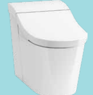
BỒN CẦU THÔNG MINH INNATE™ PHIÊN BẢN ĐẶT SÀN K-8340K-2-0