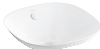
CHẬU RỬA ĐẶT BÀN VEIL ESSENTIAL™ (VUÔNG) K-26407T-0