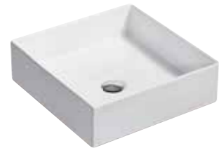
CHẬU RỬA ĐẶT BÀN MICA™ (VUÔNG) K-90011T-0