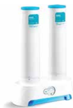
BỘ LỌC NƯỚC CUFF™ 7500 K-5339T-KT400

* ĐỘNG VẬT NGUYÊN SINH TRUYỀN NHIỄM PHỔ BIẾN VỚI ĐƯỜNG KÍNH KHOẢNG 0,5-1UM.