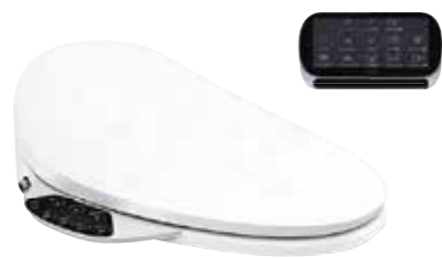
NẮP BỒN CẦU ĐIỆN TỬ C3-230 K-4108T-0