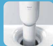
THIẾT BỊ LỌC NƯỚC