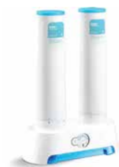
BỘ LỌC NƯỚC CUFF™ 3000 K-5339T-KT100

NƯỚC LÀ NGUỒN TÀI NGUYÊN CỦA SỰ SỐNG VÀ LÀ NỀN TẢNG CỦA SỨC KHỎE. CHÚNG TÔI LUÔN NỖ LỰC ĐỂ BIẾN MỖI GIỌT NƯỚC ĐỀU TỐT CHO SỨC KHỎE VÀ CUỘC SỐNG