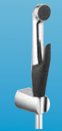
VÒI XỊT VỆ SINH LUXE ™