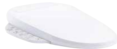
NẮP BỒN CẦU ĐIỆN TỬ C3-150 K-8297KR-0