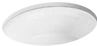
CHẬU RỬA ẨM BÀN HARKEN™ (OVAL) K-21782T-0