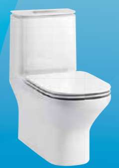
BỒN CẦU MỘT KHỐI MODERNLIFE ™

ĐẢM BẢO VỆ SINH CHÍNH LÀ PHƯƠNG PHÁP PHÒNG NGỪA TỐI ƯU NHẪM HẠN CHẾ TÁC ĐỘNG CỦA VIRUS CORONA. HÃY CÙNG TÌM HIỂU CÁC CHỨC NĂNG VỆ SINH ĐƯỢC CẢI TIẾN TRONG NHỮNG SẢN PHẨM CỦA KOHLER ĐỂ ĐEM LẠI SỰ BẢO VỆ TỐT HƠN CHO GIA ĐÌNH BẠN.