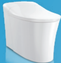
BỒN CẦU THÔNG MINH EIR™ TRẮNG K-77795MY-0