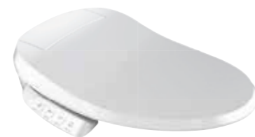
NẮP BỒN CẦU ĐIỆN TỬ C3-050 K-18751X-0