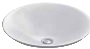
CHẬU RỬA ĐẶT BÀN CARILLON™ (TRÒN) K-96118T-0