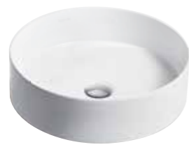
CHẬU RỬA ĐẶT BÀN MICA™ (TRÒN) K-90012T-0