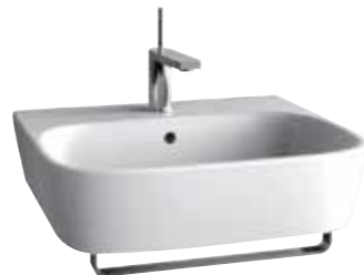
CHẬU RỬA TREO TƯỜNG MODERNLIFE™ K-77767K-1-0