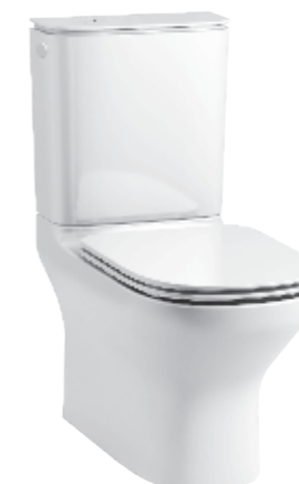
BỒN CẦU HAI KHỐI MODERNLIFE™ K-78799K-0