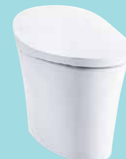
BỒN CẦU THÔNG MINH VEIL™ PHIÊN BẢN ĐẶT SÀN K-5401KR-0