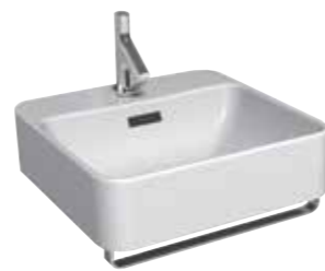
CHẬU RỬA TREO TƯỜNG FOREFRONT™ K-24985K-1-0